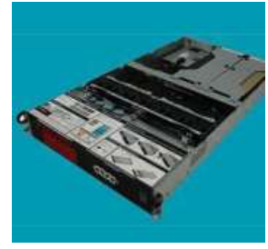
Zoho's Nathu La server chassis

The launch makes Zoho one of the few technology