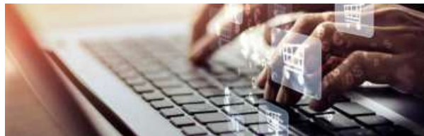
SETTING A TREND. The D2C ecosystem is moving beyond discounts, influencer-led discovery and scale-at-all-costs growth

From Nykaa, Mamaearth and Minimalist to newer brands such as Snitch, The Whole Truth and Yoga Bar, India's new-age consumer brands are increasingly paying rents to win trust.