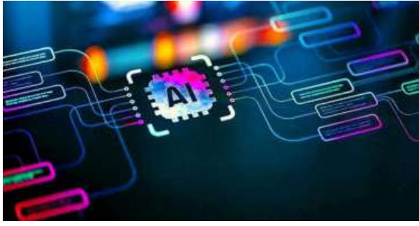
SCREAMING FOR HELP. For the first time in two years, the whole conversation around RoI on AI is getting louder

Companies are increasingly evaluating and discussing the complexity in enterprise AI adoption: increasing AI use comes with higher costs, and in that case does AI's positioning as a cost saving tool hold good?