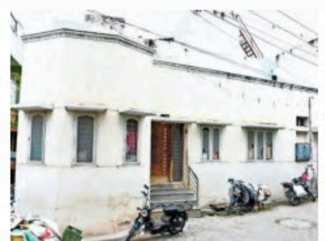
தேனி அல்லிநகரத்தில் உள்ள பாரதிராஜாவின் பூர்வீக வீடு.